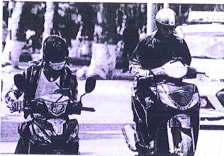
Vừa lái xe vừa nhắn tin, lướt web

Hằng ngày, trên đường phố, hình ảnh người tham gia giao thông vừa lái xe vừa sử dụng điện thoại di động đã trở nên quá quen mắt, khiến nhiều người cảm thấy bình thường. Tuy nhiên, hành động tưởng chừng nhỏ nhặt này lại là thói quen xấu, có thể gây ra tai nạn giao thông (TNGT) cho bản thân và nhiều người khác. Chỉ vài giây mất tập trung, mãi nhìn vào điện thoại, cũng có thể khiến lái xe không kịp xử lý tình huống.