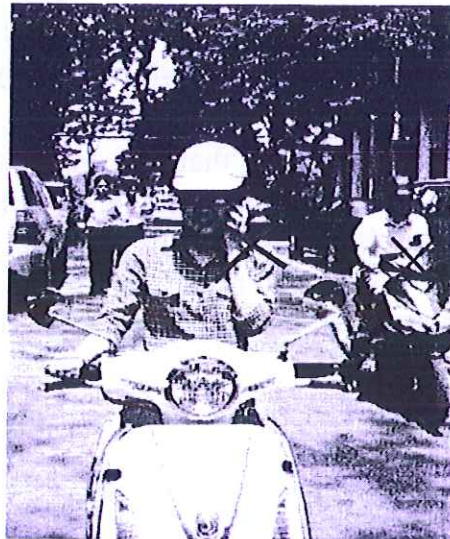
Không ít bạn trẻ có thói quen vừa chạy xe vừa sử dụng điện thoại di động

Theo phân tích của cơ quan chức năng, số vụ tai nạn giao thông do sử dụng điện thoại khi tham gia giao thông tương đương với số vụ tai nạn do người lái xe sử dụng rượu bia. Dùng điện thoại khi tham gia giao thông sẽ gây phân tâm, hạn chế khả năng quan sát, khiến người điều khiển phương tiện giao thông mất tập trung; khả năng điều khiển, kiểm soát vận tốc khi gặp tình huống bất ngờ sẽ lúng túng, không xử lý kịp thời gây tai nạn là tất yếu.