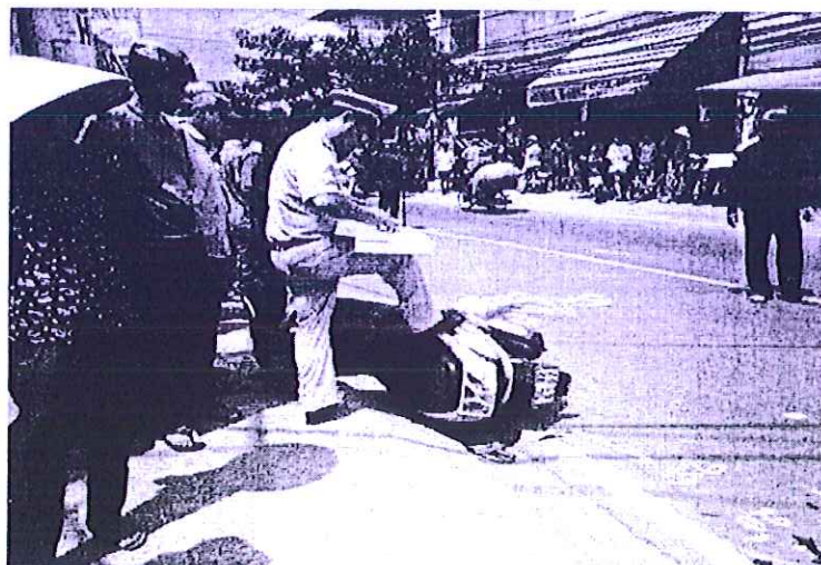
Hiện trường 1 vụ tai nạn giao thông do sử dụng điện thoại

Trên thực tế, tình trạng người tham gia giao thông sử dụng điện thoại vẫn diễn ra phổ biến do nhận thức của người dân về vấn đề này còn hạn chế và một phần do mức xử phạt còn thấp, số người vi phạm bị xử phạt chưa đáng kể. Do đó, để góp phần kéo giảm tai nạn giao thông do sử dụng điện thoại di động mang lại đòi hỏi ý thức của những người tham gia giao thông.